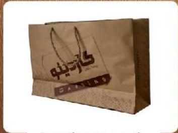
ساک دستی خوابیده (کد: ۴۰۱۴) تکرنگ کاغذ کرافت ۳۸x۲۴x۱۰cm (حداقل تعداد: ۱۰۰۰) بدون روکش ۷۹۰ تومان