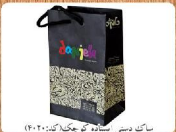
ساک دستی ایستاده کوچک (کد: ۴۰۲۰) چاپ رنگی گلاسه ۱۷۰g اندازه ۱۶x۲۶x۷cm یا ۱۶x۲۳x۱۰cm (حداقل تعداد: ۱۰۰۰) روکش سلفون مات باریک ۸۷۵۰ تومان