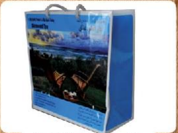
ساک دستی متوسط (کد: ۴۰۱۶) چاپ رنگی گلاسه ۱۳۵g ۲۲x۲۲x۱۰cm (حداقل تعداد: ۱۰۰۰) روکش سلفون مات/براق ۱۲۰۰ تومان