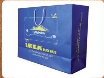
ساک دستی خوابیده بزرگ (کد: ۴۰۲۴) دو رنگ گلاسه ۱۷۰g ۴۷x۳۵x۱۲cm (حداقل تعداد: ۵۰۰) روکش سلفون مات باریک ۲۴۰۰ تومان