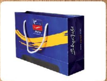
ساک دستی خوابیده (کد: ۴۰۱۲) چاپ رنگی گلاسه ۱۳۵g ۳۸x۲۴x۱۰cm (حداقل تعداد: ۱۰۰۰) روکش سلفون مات ۱۳۵۰ تومان