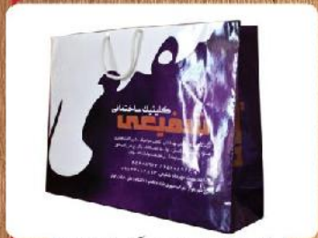
ساک دستی خوابیده بزرگ (کد: ۴۰۲۳) رنگی گلاسه ۱۳۵g ۴۷x۳۵x۱۲cm (حداقل تعداد: ۵۰۰) روکش سلفون مات باریک ۲۵۰۰ تومان