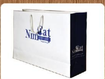
ساک دستی خوابیده (کد: ۴۰۰۸) چاپ تکرنگ گلاسه ۱۳۵g ۳۸x۲۴x۱۰cm (حداقل تعداد: ۱۰۰۰) روکش سلفون مات ۱۱۵۰ تومان