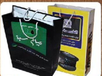
ساک دستی ایستاده (کد: ۴۰۱۰) رنگی گلاسه ۱۳۵g ۲۴x۳۸x۱۰cm (حداقل تعداد: ۱۰۰۰) روکش سلفون مات ۱۲۵۰ تومان