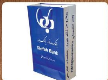
ساک دستی ایستاده (کد: ۴۰۰۹) تکرنگ گلاسه ۱۳۵g ۲۴x۳۸x۱۰cm (حداقل تعداد: ۱۰۰۰) روکش سلفون مات ۱۱۰۰ تومان