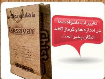
ساک دستی ایستاده (کد: ۴۰۱۵) تکرنگ کاغذ کرافت ۳۴x۳۸x۱۰cm (حداقل تعداد: ۱۰۰۰) بدون روکش ۷۵۰ تومان

تغییرات دلخواه شما در اندازه ها و گرماژ کاغذ امکان پذیر است