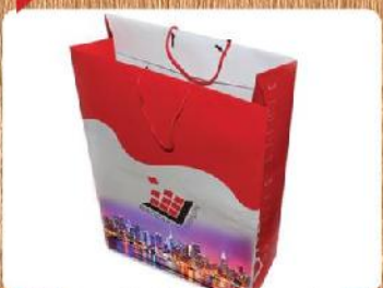
ساک دستی ایستاده بزرگ (کد: ۴۰۲۱) رنگی گلاسه ۱۳۵g ۲۵x۴۷x۱۲cm (حداقل تعداد: ۵۰۰) روکش سلفون مات ۲۵۸۰ تومان