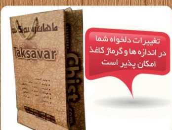
ساک دستی ایستاده (کد: ۴۰۱۵) تکرنگ کاغذ کرافت ۲۴x۳۸x۱۰cm (حداقل تعداد: ۱۰۰۰) بدون روکش