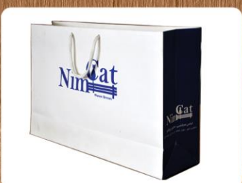
ساک دستی خوابیده (کد: ۴۰۰۸) چاپ تکرنگ گلاسه ۱۳۵g ۳۸x۲۴x۱۰cm (حداقل تعداد: ۱۰۰۰) روکش سلفون مات