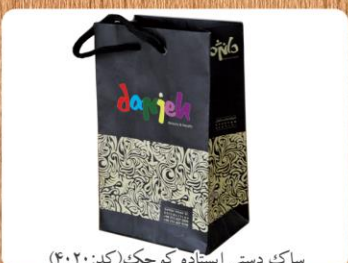
ساک دستی ایستاده کوچک (کد: ۴۰۲۰) چاپ رنگی گلاسه ۱۷۰g اندازه ۱۶x۲۶x۷cm یا ۱۶x۲۳x۱۰cm (حداقل تعداد: ۱۰۰۰) روکش سلفون مات یا براق