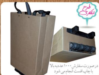
ساک دستی چرخدار بزرگ (کد: ۴۰۳۰) مقوا ضخیم لمینتی ۳۲x۵۲x۱۸cm (حداقل تعداد: ۳۰۰ عدد) چاپ سیلک تکرنگ

تغییرات دلخواه شما در اندازه ها و گرمای کلفه امکان پذیر است