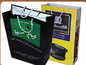
ساک دستی ایستاده (کد: ۴۰۱۰) رنگی گلاسه ۱۳۵g ۲۴x۳۸x۱۰cm (حداقل تعداد: ۱۰۰۰) روکش سلفون مات