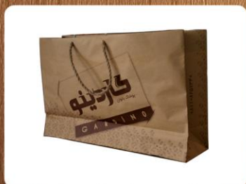
ساک دستی خوابیده (کد: ۴۰۱۴) تکرنگ کاغذ کرافت ۳۸x۲۴x۱۰cm (حداقل تعداد: ۱۰۰۰) بدون روکش