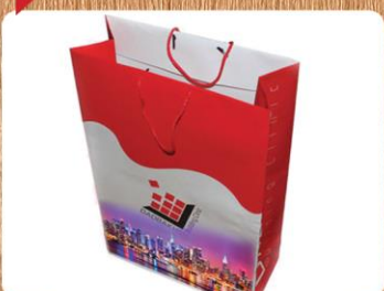
ساک دستی ایستاده بزرگ (کد: ۴۰۲۱) رنگی گلاسه ۱۳۵g ۳۵x۴۷x۱۲cm (حداقل تعداد: ۵۰۰) روکش سلفون مات