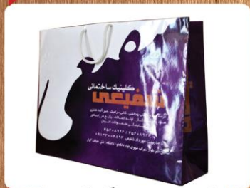
ساک دستی خوابیده بزرگ (کد: ۴۰۲۳) رنگی گلاسه ۱۳۵g ۴۷x۳۵x۱۲cm (حداقل تعداد: ۵۰۰) روکش سلفون مات یا براق