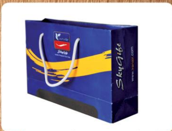
ساک دستی خوابیده (کد: ۴۰۱۲) چاپ رنگی گلاسه ۱۳۵g ۳۸x۲۴x۱۰cm (حداقل تعداد: ۱۰۰۰) روکش سلفون مات