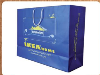
ساک دستی خوابیده بزرگ (کد: ۴۰۲۴) دو رنگ گلاسه ۱۷۰g ۴۷x۳۵x۱۲cm (حداقل تعداد: ۵۰۰) روکش سلفون مات یا براق