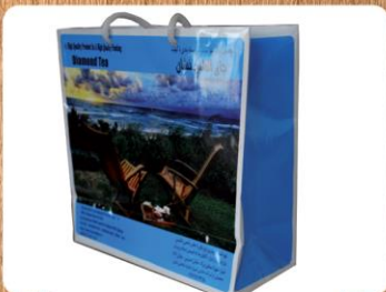
ساک دستی متوسط (کد: ۴۰۱۶) چاپ رنگی گلاسه ۱۳۵g ۲۲x۲۲x۱۰cm (حداقل تعداد: ۱۰۰۰) روکش سلفون مات یا براق