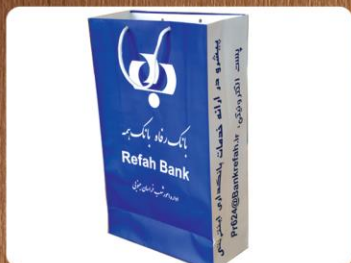
ساک دستی ایستاده (کد: ۴۰۰۹) تکرنگ گلاسه ۱۳۵g ۲۴x۳۸x۱۰cm (حداقل تعداد: ۱۰۰۰) روکش سلفون مات