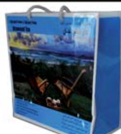
ساک دستی متوسط (کد:۴۰۱۶) چاپ رنگی گچ ۱۳۵g ۲۲x۲۲x۱۰cm (حداقل تعداد: ۱۰۰۰) روکش سفون مات/باریک