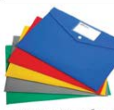
پاکت دگمه دار A۴ (کد: ۲۵۱۱) A۵ (حداقل: ۳۰۰ عدد) چاپ ملاکوب - هزینه کلیشه: ۲۵۰۰۰ تومان