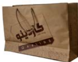
ساک دستی خوابیده (کد:۴۰۱۴) تکرنگ کاغذ کرافت ۲۴x۳۱x۱۰cm (حداقل تعداد: ۱۰۰۰) بدون روکش