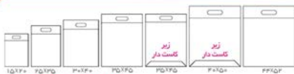
ساک های سوزنی دسته پانچی