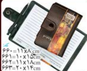
دفتر یادداشت خارجی (کد: ۶۶۰) در چهار اندازه (حداقل: ۱۰۰ عدد) چاپ ملاکوب - هزینه کلیشه: ۲۵۰۰۰ تومان