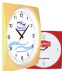
ساعت دیواری مربع (کد: ۵۵۰۴) قطر دایره ۲۹cm - چاپ رنگی (حداقل تعداد: ۴۸ عدد) رنگ بندی دارد