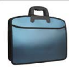
کیف اداری طلایی (کد: ۲۶۲۷) (حداقل: ۵۰ عدد) چاپ ملاکوب - هزینه کلیشه: ۲۵۰۰۰ تومان