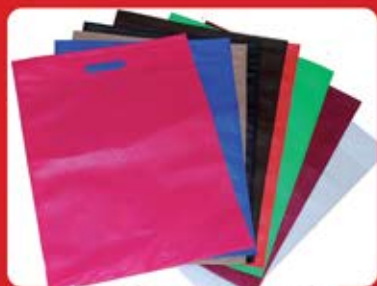
ساک سوزنی دسته پانچی (کد: ۴۱۴۲) چندین رنگ ۴۵x۳۵cm - چاپ سیلک (حداقل تعداد: ۵۰۰ عدد/هزینه کلیشه: ۲۵۰۰ تومان)