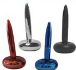
خودکار پایه دار آهنربایی (کد: ۱۴۸۲) با چاب لیزر (حداقل تعداد: ۵۰ عدد/هزینه کلیشه: ۲۵۰۰ تومان)