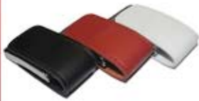
فلش ۸ گیگ جرمی (کد: ۳۲۱۱) (حداقل: ۲۴ عدد) چاپ لیزر - هزینه کلیشه: ۲۵۰۰۰ تومان