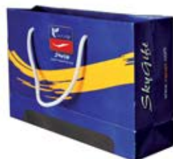
ساک دستی خوابیده (کد:۴۰۱۲) چاپ رنگی گچ ۱۳۵g ۳۸x۲۴x۱۰cm (حداقل تعداد: ۱۰۰۰) روکش سفون مات