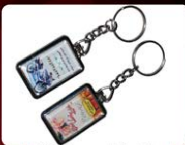
جاکلیدی قابدار-دورو- (کد:۳۵۴۴) چاپ رنگی (حداقل تعداد: ۵۰ عدد)