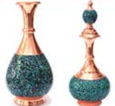
ظروف فیروزه (کد: ۳۱۸۸) (اندازه های متنوع) چاپ لیزر نوع موجودی در زمان سفارش