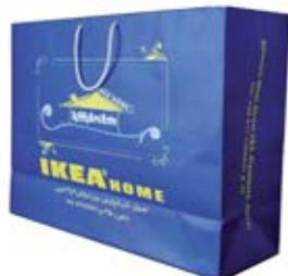
ساک دستی خوابیده بزرگ (کد:۴۰۲۴) دورنگ گلاسه ۱۷۰g ۴۷x۳۵x۱۲cm (حداقل تعداد: ۵۰۰) روکش سفون مات باریک