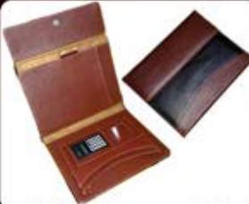
کلاسور سبزی جرم (کد: ۲۴۴۲) حداقل تعداد سفارش: ۵۰ عدد چاپ لیزر/سیلک - هزینه کلیشه: ۲۵۰۰۰ تومان