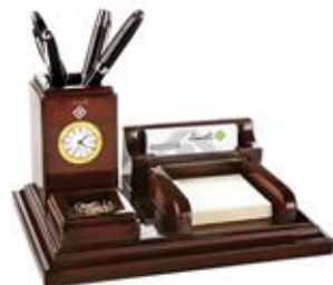
ست مدیریتی رومیزی نفیس (کد: ۳۵۰۵) با ساعت و یادداشت - چاپ لیزر (حداقل تعداد: ۱۲ عدد) هزینه کلیشه ۲۵۰۰۰ تومان