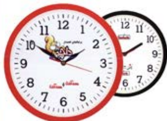
ساعت دیواری مربع (کد: ۵۵۰۳) قطر ساعت ۳۲cm - چاپ رنگی (حداقل تعداد: ۴۸ عدد) رنگ بندی دارد