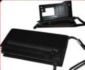
کیف پول پولانو (کد: ۲۳۴۲) بسیار زیبا و جادار (زنانه و مردانه) چاپ لیزر/سیلک - هزینه کلیشه: ۲۵۰۰۰ تومان