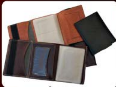
جلد مدارک چسبدار بزرگ (کد: ۲۳۹۲) چاپ طلاکوب یا تامبو (حداقل تعداد: ۱۰۰ عدد/هر نه کلیشه ۲۵۰۰ تومان)