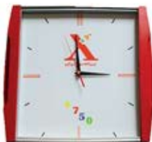
ساعت دیواری مربع (کد: ۵۵۰۹) قسمت چاپ ۳۰cm - چاپ رنگی (حداقل تعداد: ۴۸ عدد)