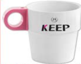
لیوان ماگ انگشتی (کد: ۳۱۷۷) (سفید) - چاپ تامبو (حداقل: ۲۰۰ عدد) - هزینه کلیشه: ۲۵۰۰۰ تومان