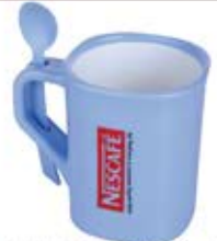
لیوان ماگ قاشقدار (کد: ۳۱۷۵) (رنگ بندی) - چاپ تامبو (حداقل: ۲۰۰ عدد) - هزینه کلیشه: ۲۵۰۰۰ تومان