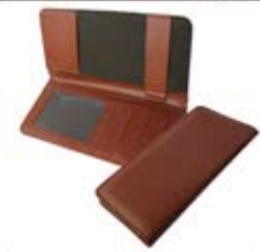
کیف دسته چک (کد: ۲۴۱۵) مدل های متنوع در وب سایت ملاکوب/لیزر - هزینه کلیشه: ۲۵۰۰۰ تومان