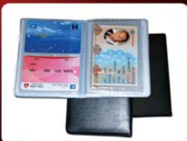
جلد مدارک فوم (کد: ۲۳۸۱) کارت بزرگ و کارت بانکی (حداقل تعداد: ۱۵۰ عدد/هر نه کلیشه ۲۵۰۰ تومان)