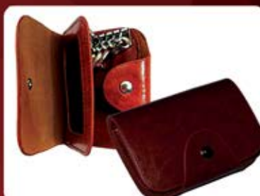
کیف سرکلیدی ترمو (کد: ۲۳۹۱) چاپ طلاکوب یا لیزر (حداقل تعداد: ۵۰ عدد/هر نه کلیشه ۲۵۰۰ تومان)