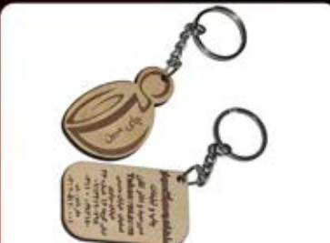
جاکلیدی MDF (کد:۳۵۴۰) چاپ و ساخت لیزری (حداقل تعداد: ۳۰ عدد)