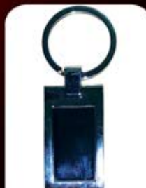
جاکلیدی فلزی قاب مستطیل (کد:۳۵۵۵) چاپ لیزر (بدون جعبه) (حداقل تعداد: ۵۰ عدد)