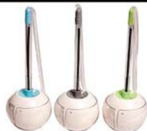
خودکار پایه دار توپی (کد: ۱۴۸۴) با چاب تامبو (حداقل تعداد: ۳۰۰ عدد/هزینه کلیشه: ۲۵۰۰ تومان)