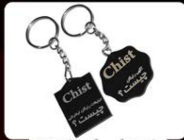
جاکلیدی بلکسی-یکرو- (کد:۳۵۲۶) چاپ و ساخت لیزری (حداقل تعداد: ۳۰ عدد)