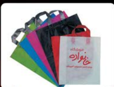
نایلکس دسته جدا بندی (کد: ۴۱۳۳) چندین رنگ ۴۰x۴۰cm - چاپ سیلک (حداقل: ۲۰۰ کیلو) هزینه کلیشه: ۲۵۰۰ تومان