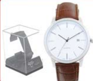
ساعت مچی (کد: ۵۳۲۲) با جعبه مخصوص - با چاپ داخل صفحه (حداقل تعداد: ۴۸ عدد) هزینه کلیشه ۲۵۰۰۰ تومان