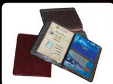
جلد مدارک پوست ماری (کد: ۲۳۸۰) چاپ طلاکوب (کارت بانکی و بزرگ) (حداقل تعداد: ۱۵۰ عدد/هر نه کلیشه ۲۵۰۰ تومان)