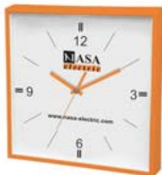
ساعت دیواری مربع جدید (کد: ۵۵۶۰) ۳۲cm - چاپ رنگی (حداقل تعداد: ۴۸ عدد) رنگ بندی دارد