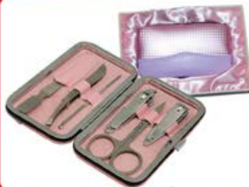
ست مائیکور (کد: ۳۰۴۶) با چاب لیزر روی کیف - با جعبه (حداقل تعداد: ۵۰ عدد/هزینه کلیشه: ۲۵۰۰ تومان)