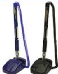
خودکار پایه دار اصلی (کد: ۱۴۱۸) با چاب تامبو (حداقل تعداد: ۳۰۰ عدد/هزینه کلیشه: ۲۵۰۰ تومان)