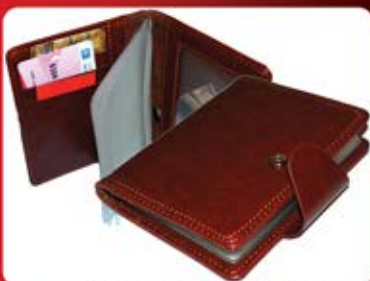
جلد مدارک بزرگ دگمه ای (کد: ۲۳۷۰) بسیار جادار و وشکیل (داغی یا لیزر) (حداقل تعداد: ۱۰۰ عدد/هر نه کلیشه ۲۵۰۰ تومان)