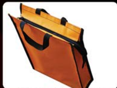
ساک برزنتی زیب دار (واتر) (کد: ۴۱۲۲) چاپ سیلک اندازه: ۳۷x۳۰x۹cm هزینه کلیشه: ۲۵۰۰ تومان (حداقل: ۲۲۵ عدد)