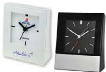
ساعت رومیزی پورتوک (کد: ۵۳۵۲) در دو رنگ - چاپ تامبو (حداقل تعداد: ۴۸ عدد) هزینه کلیشه ۲۵۰۰۰ تومان