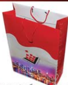
ساک دستی ایستاده بزرگ (کد:۴۰۲۱) رنگی گلاسه ۱۳۵g ۳۵x۴۷x۱۲cm (حداقل تعداد: ۵۰۰) روکش سفون مات