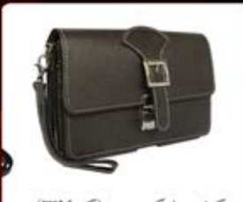
کیف مدارک دستی (کد: ۲۳۹۶) طرح متنوع دیگر در وبسایت چاپ لیزر - هزینه کلیشه: ۲۵۰۰۰ تومان