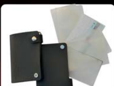
جلد کارت اعتباری خارجی (کد: ۲۳۹۴) چاپ طلاکوب ، داغی یا تامبو (حداقل تعداد: ۱۵۰ عدد/هر نه کلیشه ۲۵۰۰ تومان)