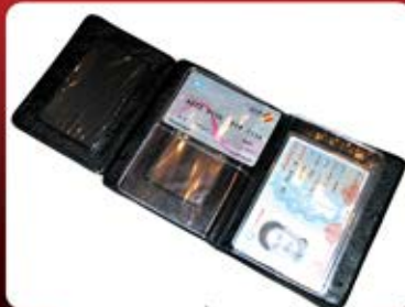
جلد مدارک سه تکه (کد: ۲۳۸۹) چاپ طلاکوب یا تامبو (حداقل تعداد: ۱۰۰ عدد/هر نه کلیشه ۲۵۰۰ تومان)