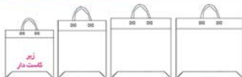
ساک های سوزنی دسته جدا