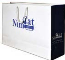
ساک دستی خوابیده (کد:۴۰۰۸) چاپ تکرنگ گچ ۱۳۵g ۳۸x۲۴x۱۰cm (حداقل تعداد: ۱۰۰۰) روکش سفون مات