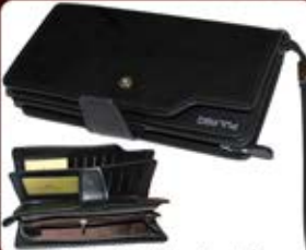
کیف پول پولانو (کد: ۲۳۴۱) بسیار زیبا و جادار (زنانه و مردانه) چاپ لیزر/سیلک - هزینه کلیشه: ۲۵۰۰۰ تومان