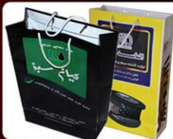
ساک دستی ایستاده (کد:۴۰۱۰) رنگی گلاسه ۱۳۵g ۲۴x۳۱x۱۰cm (حداقل تعداد: ۱۰۰۰) روکش سفون مات