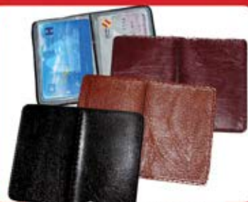
جلد کارت پوست ماری (کد: ۲۳۸۲) چاپ طلاکوب یا تامبو (حداقل تعداد: ۱۵۰ عدد/هر نه کلیشه ۲۵۰۰ تومان)