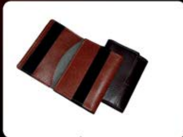
جلد کارت چسبدار کوچک (کد: ۲۳۹۷) چاپ طلاکوب (فقط جا کارت بانکی) (حداقل تعداد: ۱۵۰ عدد/هر نه کلیشه ۲۵۰۰ تومان)