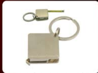
جاکلیدی فلزی استیل متری (کد:۳۵۱۰) چاپ لیزر (حداقل تعداد: ۵۰ عدد/هزینه کلیشه: ۲۵۰۰ تومان)