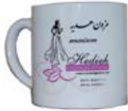
لیوان سرامیکی توجهت (کد: ۳۱۷۴) سفید - چاپ رنگی (حداقل: ۲۴ عدد) - هزینه کلیشه: ۲۵۰۰۰ تومان