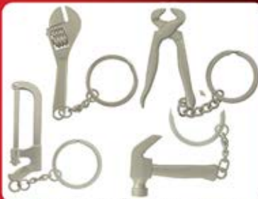
جاکلیدی استیل (ابزارآلات) کد:۳۵۷۸ چاپ لیزر (حداقل تعداد: ۵۰ عدد/هزینه کلیشه: ۲۵۰۰ تومان)