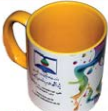
لیوان سرامیکی بزرگ (کد: ۳۱۷۳) سفید - چاپ رنگی (حداقل: ۲۴ عدد) - هزینه کلیشه: ۲۵۰۰۰ تومان