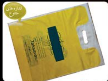
نایلکس دسته تقویتی (کد: ۴۱۲۵) چندین رنگ ۳۵x۴۵cm - چاپ سیلک (حداقل: ۲۰۰ کیلو) هزینه کلیشه: ۲۵۰۰ تومان