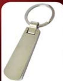
جاکلیدی فلزی ساده (کد:۳۵۵۶) چاپ لیزر (بدون جعبه) (حداقل تعداد: ۵۰ عدد)