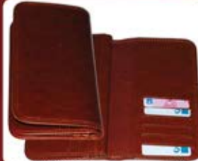
کیف پول سررط ترمو (کد: ۲۳۹۵) جعبه مخصوص (حداقل: ۲۴ عدد) چاپ لیزر - هزینه کلیشه: ۲۵۰۰۰ تومان