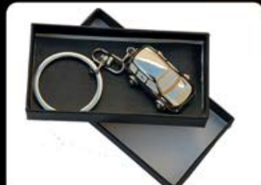
جاکلیدی فلزی ماشین (کد:۳۵۵۴) چاپ لیزر (با جعبه) (حداقل تعداد: ۵۰ عدد/هزینه کلیشه: ۲۵۰۰ تومان)