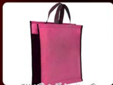
ساک سوزنی تمام گانگس (کد: ۴۱۵۰) رنگ دلخواه ۴۰x۲۵x۱۰cm - سیلک (حداقل تعداد: ۵۰۰ عدد/هزینه کلیشه: ۲۵۰۰ تومان)