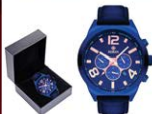
ساعت مچی نفیس (کد: ۵۳۴۲) با جعبه مخصوص - با چاپ داخل صفحه (حداقل تعداد: ۴۸ عدد) هزینه کلیشه ۲۵۰۰۰ تومان