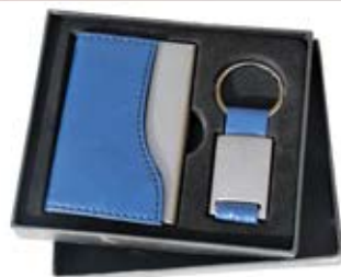
چاکلیدی و جا کارت (کد: ۳۲۵۴) با چاب لیزر - با جعبه (حداقل تعداد: ۵۰ عدد/هزینه کلیشه: ۲۵۰۰ تومان)