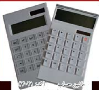
ماشین حساب (کد: ۱۶۳۱) با چاب تامبو (حداقل تعداد: ۵۰ عدد/هزینه کلیشه: ۲۵۰۰ تومان)