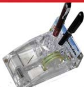
چاقوسی شیشه ای کوچک (کد: ۳۰۹۸) با چاب تامبو (حداقل تعداد: ۵۰ عدد/هزینه کلیشه: ۲۵۰۰ تومان)