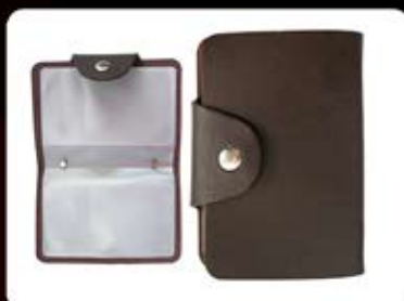
جلد کارت اعتباری (کد: ۲۳۹۹) چاپ طلاکوب (فقط جا کارت بانکی) (حداقل تعداد: ۱۵۰ عدد/هر نه کلیشه ۲۵۰۰ تومان)