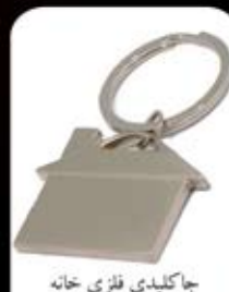
جاکلیدی فلزی خانه (کد:۳۵۴۸) چاپ لیزر (بدون جعبه) (حداقل تعداد: ۵۰ عدد) هزینه کلیشه: ۲۵۰۰ تومان