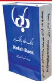
ساک دستی ایستاده (کد:۴۰۰۹) تکرنگ گلاسه ۱۳۵g ۲۴x۳۱x۱۰cm (حداقل تعداد: ۱۰۰۰) روکش سفون مات