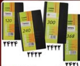
آلبوم کارت ویزیت (کد: ۲۴۲۱) ظرفیت: ۳۶۸/۳۰۰/۲۴۰/۱۲۰ تایی چاپ ملاکوب - هزینه کلیشه: ۲۵۰۰۰ تومان