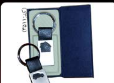
جاکلیدی فلزی و چرم (کد:۳۵۱۲) چاپ لیزر (جعبه جداگانه) (حداقل تعداد: ۵۰ عدد/هزینه کلیشه: ۲۵۰۰ تومان)