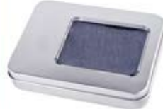
جعبه خالی (کد: ۳۲۱۳) جهت فلش مموری و ... چاپ تامبو یا برجست