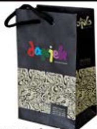
ساک دستی ایستاده کوچک (کد:۴۰۲۰) چاپ رنگی گلاسه ۱۷۰g اندازه ۱۶x۲۴x۱۰cm یا ۱۶x۲۶x۷cm (حداقل تعداد: ۱۰۰۰) روکش سفون مات باریک