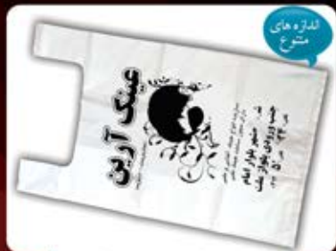
نایلکس دسته رکابی متوسط (کد: ۴۱۳۰) در چندین رنگ - با چاپ سیلک (حداقل: ۲۰۰ کیلو) هزینه کلیشه: ۲۵۰۰ تومان