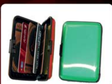
جعبه کارت اعتباری (کد: ۲۳۹۰) چاپ تامبو (فقط جا کارت بانکی) (حداقل تعداد: ۱۰۰ عدد/هر نه کلیشه ۲۵۰۰ تومان)