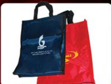
ساک برزنتی (واتر) (کد: ۴۱۲۱) چاپ سیلک اندازه: ۳۷x۳۰x۹cm هزینه کلیشه: ۲۵۰۰ تومان (حداقل: ۲۲۵ عدد)