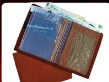
جلد مدارک کیف پولی (کد: ۲۳۸۵) چاپ طلاکوب یا تامبو (حداقل تعداد: ۱۰۰ عدد/هر نه کلیشه ۲۵۰۰ تومان)