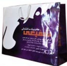
ساک دستی خوابیده بزرگ (کد:۴۰۲۳) رنگی گلاسه ۱۳۵g ۴۷x۳۵x۱۲cm (حداقل تعداد: ۵۰۰) روکش سفون مات باریک