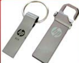
فلش ۸ گیگ HP (کد: ۳۲۱۲) اشکال مختلف (حداقل: ۲۴ عدد) چاپ لیزر - هزینه کلیشه: ۲۵۰۰۰ تومان