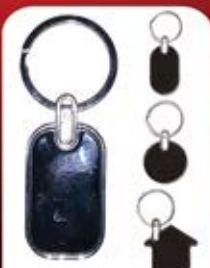
جاکلیدی فلزی حاشیه دار (کد:۳۵۵۷) چهار طرح چاپ لیزر (بدون جعبه) (حداقل تعداد: ۵۰ عدد)