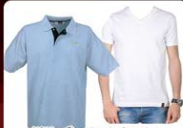
تی شرت یقه دار مرغوب (کد: ۳۶۳۳) تی شرت هفت (کد: ۳۶۳۲) با چاب سیلک یا چاب حرازی (حداقل تعداد: ۴۸ عدد/هزینه کلیشه: ۲۵۰۰ تومان)