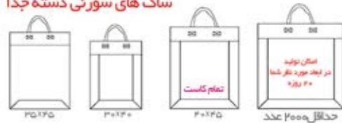
امکان تولید در ابعاد مورد نظر شما ۴۰ روزگار تمام کاست حداقل ۲۰۰۰ عدد