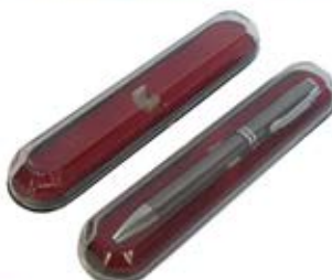
جعبه خالی خودکار (کد: ۱۷۳۹) مخصوص خودکارهای تبلیغاتی