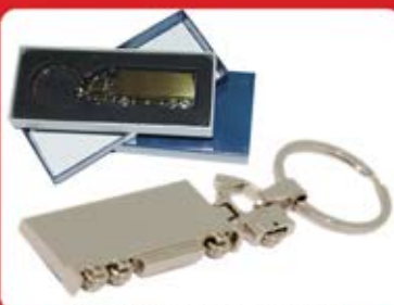
جاکلیدی استیل ترازیت (کد:۳۵۱۳) با جعبه مخصوص - چاپ لیزر (حداقل تعداد: ۵۰ عدد/هزینه کلیشه: ۲۵۰۰ تومان)