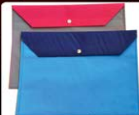
پاکت دگمه دار (کد: ۲۵۱۴) پارچه سوزنی - حداقل: ۳۰۰ عدد سیلک/ملاکوب - هزینه کلیشه: ۲۵۰۰۰ تومان