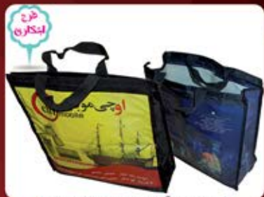
ساک دوردوز گلاس و برزنت (کد: ۴۱۲۰) چاپ کامل رنگی ۳۷x۳۷x۱۰cm (حداقل: ۵۰۰ عدد) دو طرف یک طرح