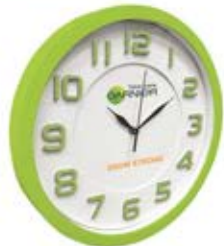
ساعت دیواری دایره (کد: ۵۳۶۲) اعداد برجسته - چاپ رنگی (حداقل تعداد: ۴۸ عدد)