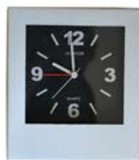
ساعت نقره ای پورتوک (کد: ۵۳۵۳) رومیزی و هم دیواری - چاپ تامبو (حداقل تعداد: ۴۸ عدد) هزینه کلیشه ۲۵۰۰۰ تومان