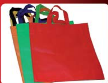
ساک سوزنی دسته پانچی (کد: ۴۱۴۶) چندین رنگ ۴۰x۴۰cm - چاپ سیلک (حداقل تعداد: ۵۰۰ عدد/هزینه کلیشه: ۲۵۰۰ تومان)