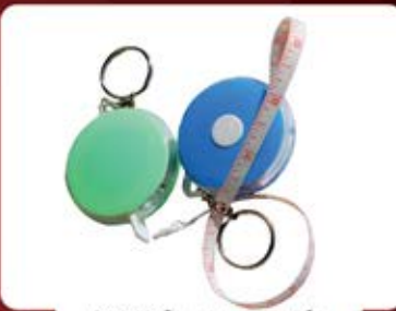
جاکلیدی متر دایره (کد:۳۵۷۷) چاپ نامبر (بدون جعبه) (حداقل تعداد: ۱۵۰ عدد/هزینه کلیشه: ۲۵۰۰ تومان)