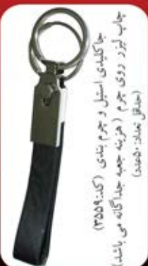
جاکلیدی استیل و چرم بندی (کد:۳۵۵۹) چاپ لیزر روی چرم (هزینه جعبه جداگانه می باشد) (حداقل تعداد: ۵۰ عدد)