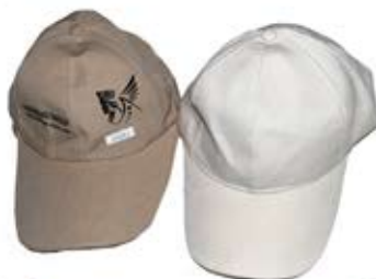
کلاه کتان (کد: ۳۶۲۰) با چاب حرارتی رنگی و یا سیلک (حداقل: ۲۰۰ عدد/هزینه کلیشه: ۲۵۰۰ تومان)