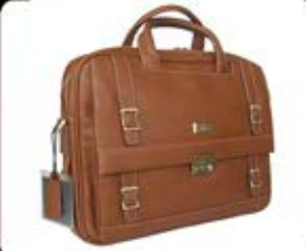
کیف اداری مدیریتی (کد: ۲۶۱۰) جرم مرغوب (حداقل: ۲۰ عدد) چاپ لیزر - هزینه کلیشه: ۲۵۰۰۰ تومان