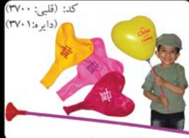
کد: قلبی (۳۷۰۰) دایره: ۱۰ (۳۷۰۱) بادکنک قلبی و دایره بانی و گبره با چاب پیکرو و یا دورو (حداقل: ۱۰۰۰ عدد/هزینه کلیشه: ۲۵۰۰ تومان)