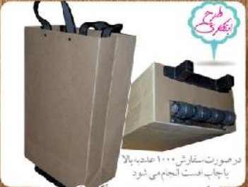
ساک دستی چرخدار بزرگ (کد: ۴۰۳۰) مقوا ضخیم لمبیتی ۳۳x۵۲x۱۸cm (حداقل تعداد: ۳۰۰ عدد) چاپ سلیک تکرنگ ۱۱۰۰۰ تومان

تغییرات دلخواه شما در اندازه ها و گرماژ کاغذ امکان پذیر است